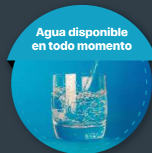
Agua disponible en todo momento