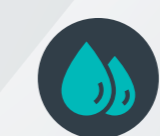
Agua de baja mineralización