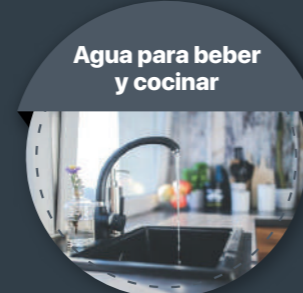
Agua para beber y cocinar