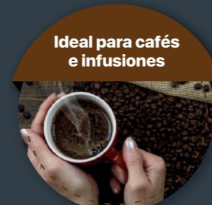
Ideal para cafés e infusiones